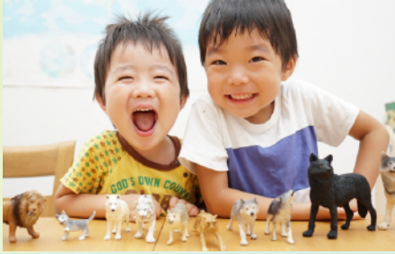
(30代夫婦 2人小学生1人保育園児1人) ※写真はイメージとなります。